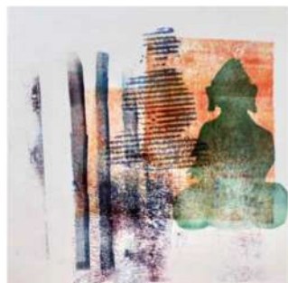
„Buda“, Monotypie, 20 x 20 cm, 2020

Die in Argentinien geborene Künstlerin hat sowohl in Argentinien als auch in Deutschland in Einzel- und Gruppenausstellungen ihre Werke gezeigt. Sie lebt und arbeitet in Rondorf, Köln, und Laborde, Argentinien.