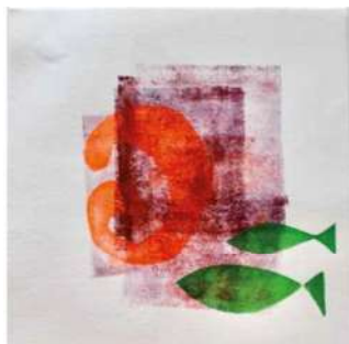
„Pez“, Monotypie, 20 x 20 cm, 2020