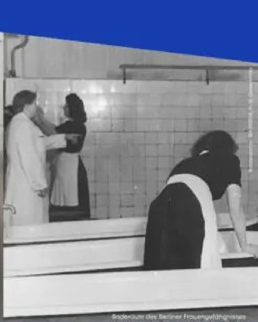
Badezimmer des Berliner Frauengefängnisses