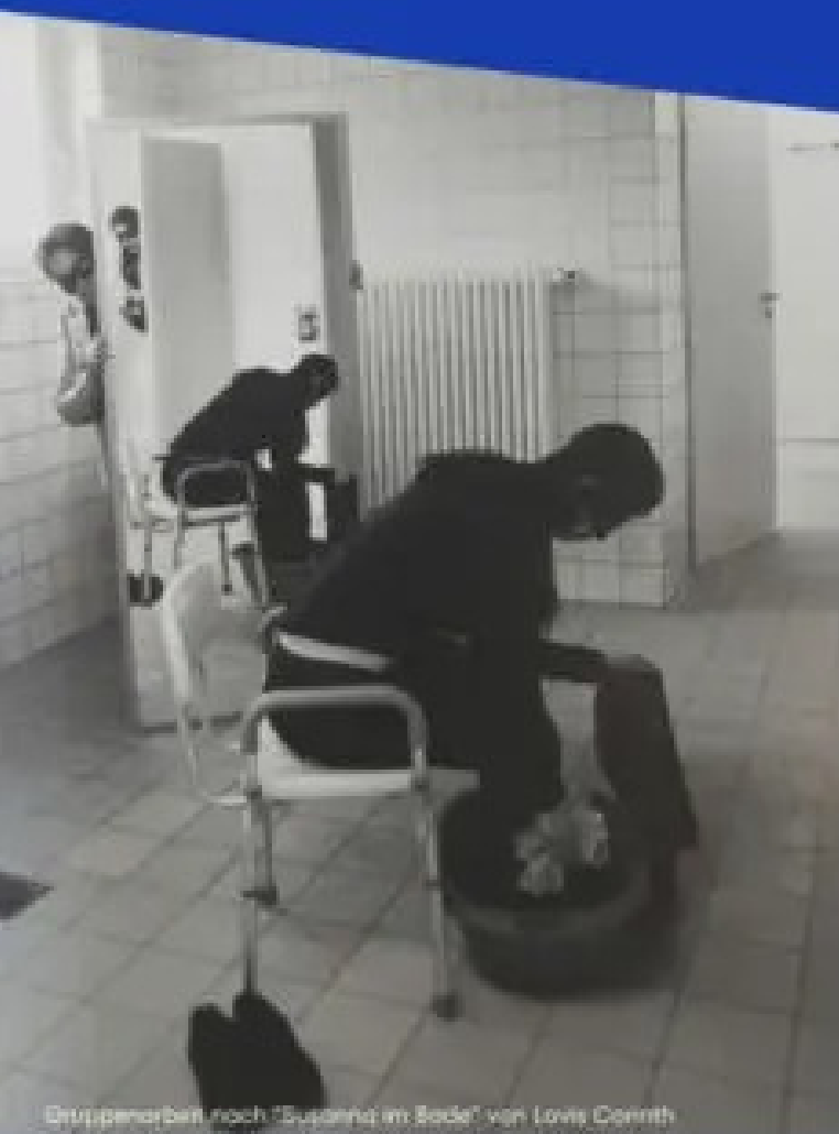
Gruppenarbeit nach "Spannung im Bade" von Louis Cornth

Kunst von Inhaftierten + Geschichte der Frauenkriminalität